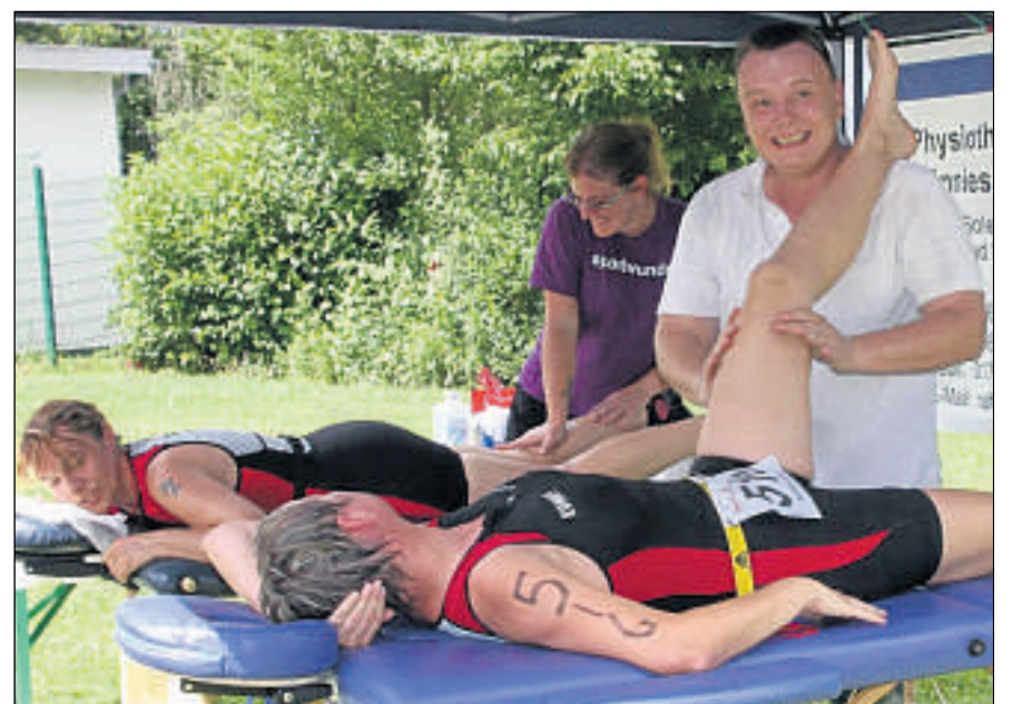
Entspannung: Massiert wurden die Triathleten nach dem anstrengenden Wettkampf vom Ehepaar Tönnies aus der Physiotherapiepraxis in Bad Sooden-Allendorf