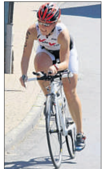
Hohes Tempo: Durchfahrt in Trubenhäusen.